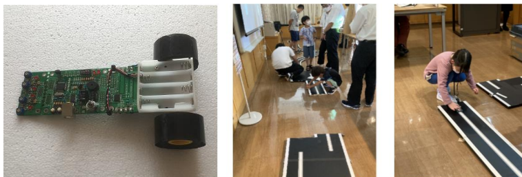
写真は前回の様子を示します。